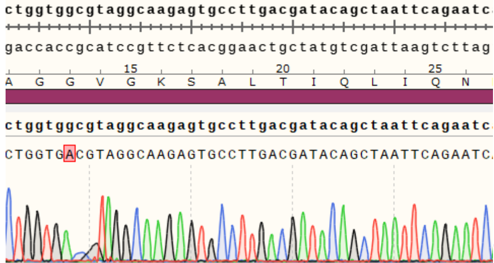
Fig 2. H_KRAS(G13D) BAF3 Cell Line 测序结果